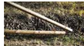
Absenkung Alternative 2