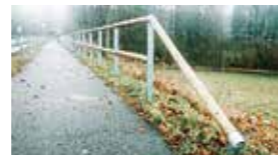
Absenkung Alternative 1