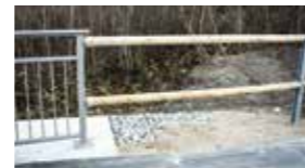
2 Rundhölzer mit Verbindung zum Geländer